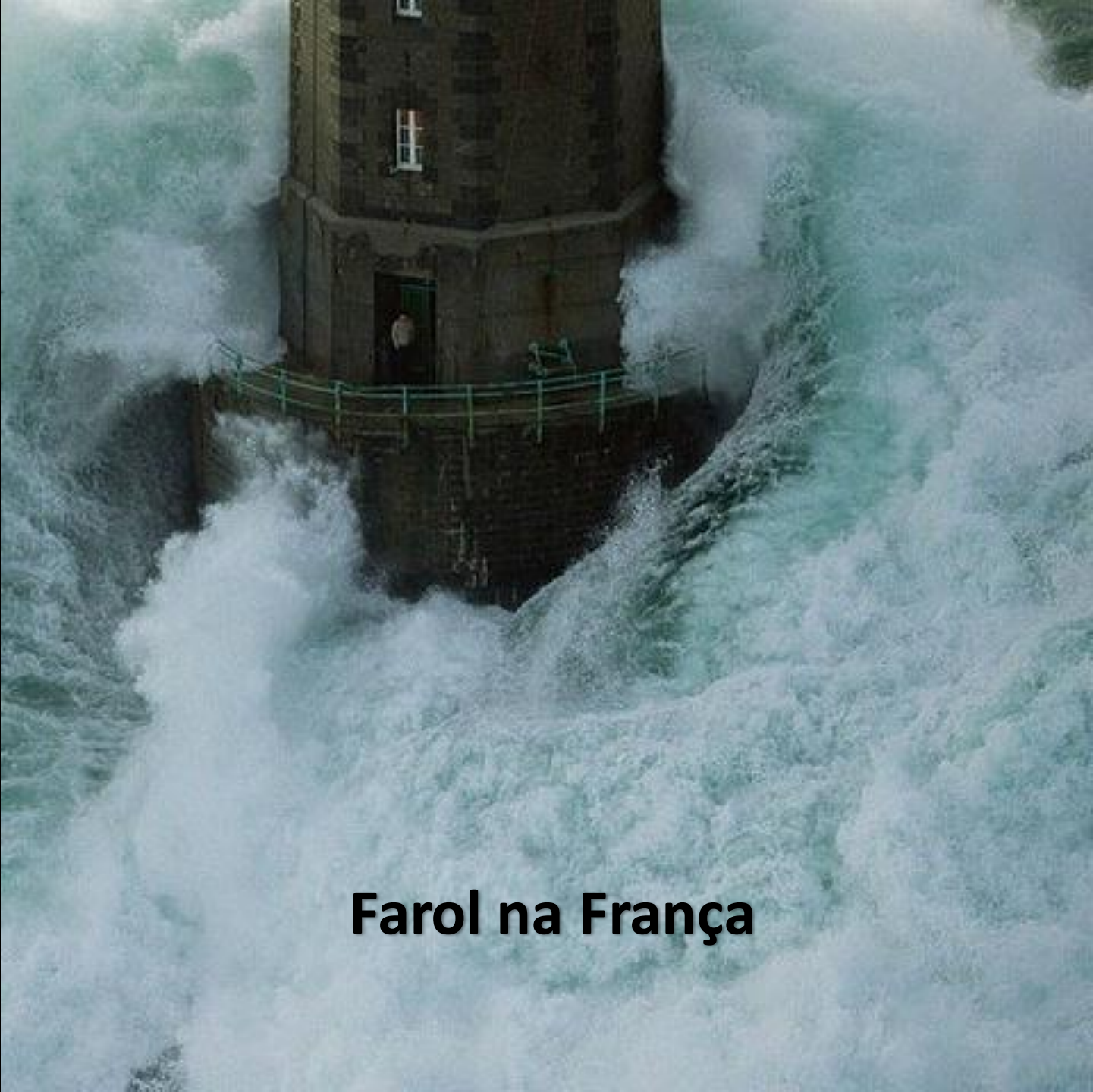
Farol na França