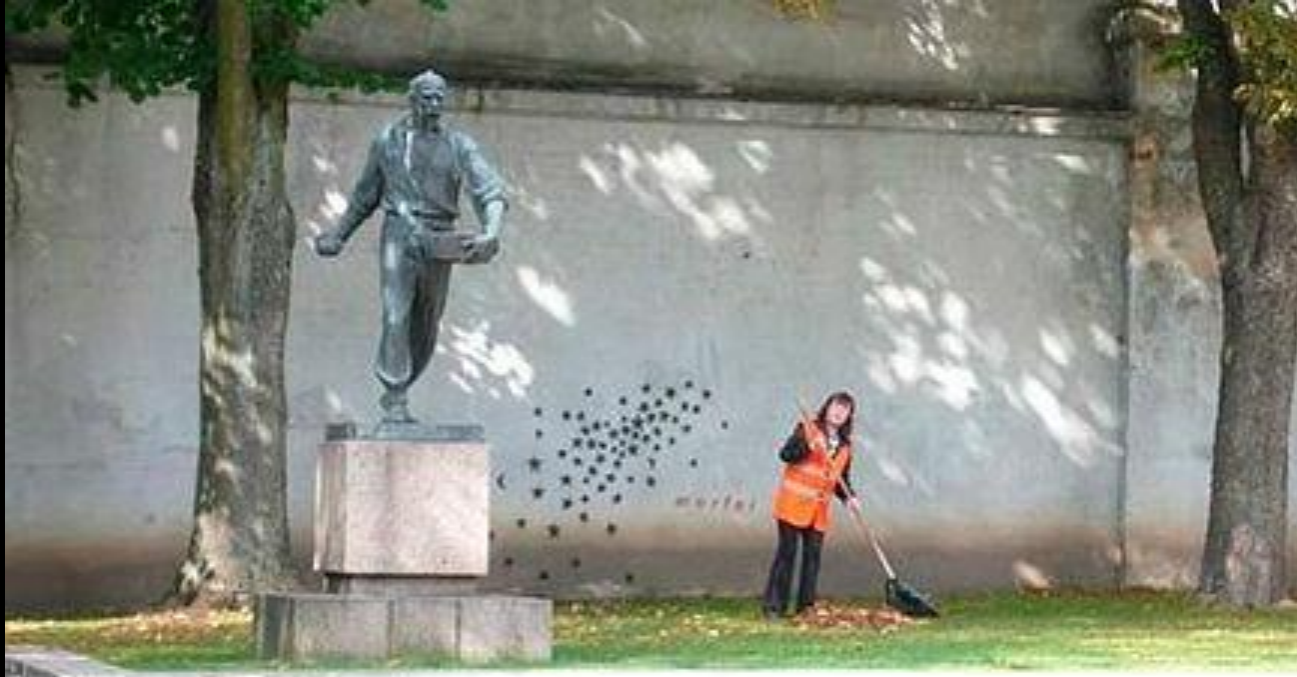
Noite e Dia. Estátua em Caunace, Litva