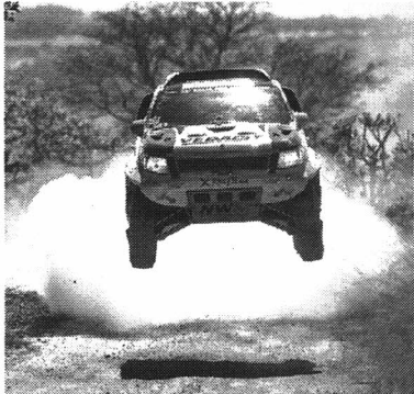
187 veículos largaram ontem, de Campo Grande

A organização vai acessar algumas áreas isoladas e carentes do Brasil durante seu percurso. Serão duas carretas-médicas com oito ambulatórios para atendimento médico às pessoas locais. Atendimentos de Dermatologia, Ginecologia, Oftalmologia e Odontologia, dentre outras ações.