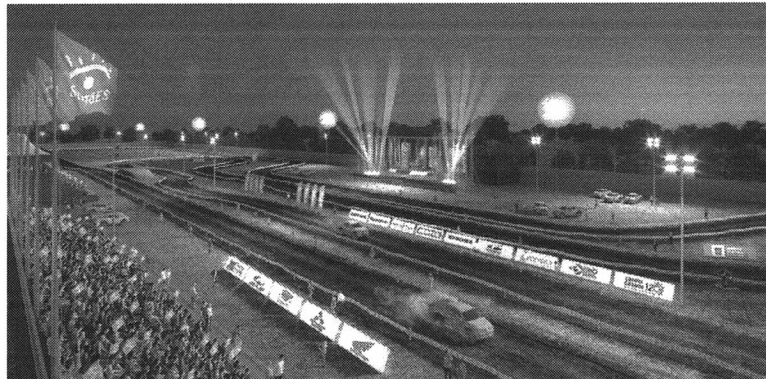
Imagem projetada da largada Super Prime (Mata-mata) realizada na Praça do Papa, em Campo Grande